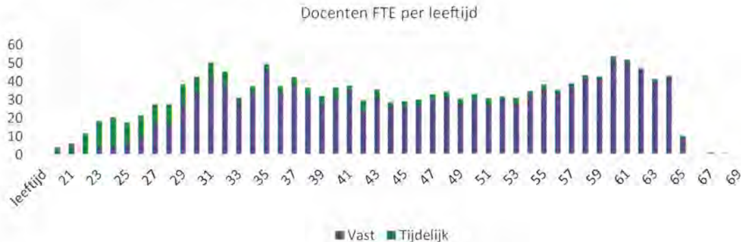
Tabel 7: leeftijdsopbouw docenten, exclusief medewerkers United World College Maastricht

Voor LVO-docenten is de leeftijdsopbouw als volgt: