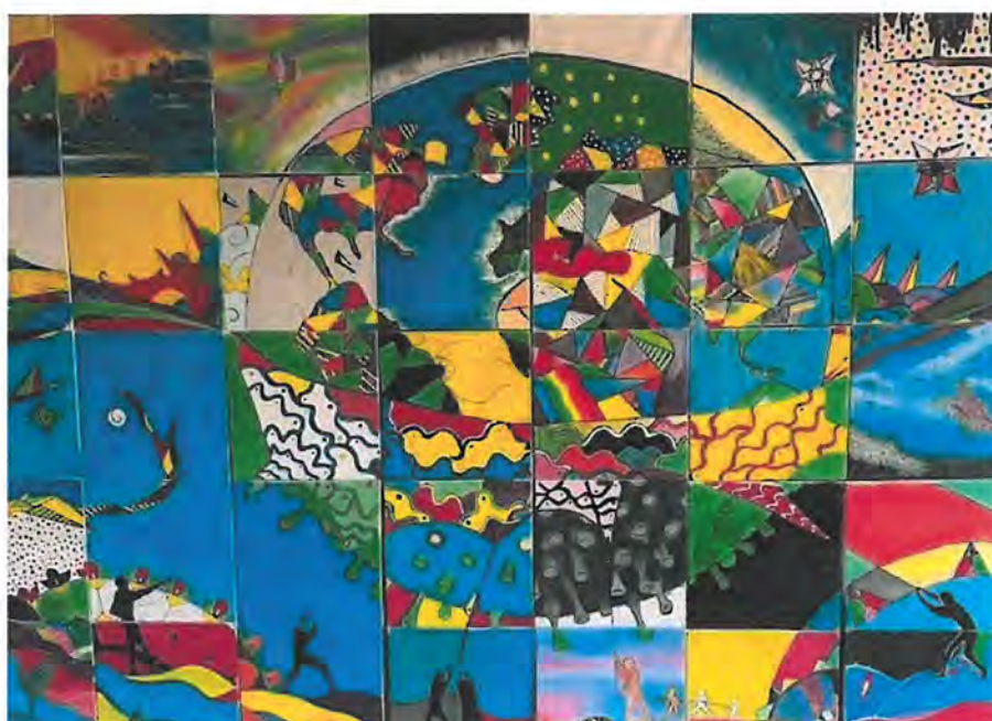
Het schilderij 'Het gevecht tegen corona' is gemaakt door leerlingen van NTC Het Kwadrant. Leerlingen kregen een vierkant met een in te kleuren ontwerp, zonder te weten aan welk groter geheel zij werkten.